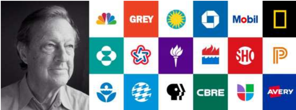
Resim 1: Chermayeff ve ikonik logoları

Chermayeff ve ekibi, Chase Manhattan Bankası, Pan Am ve Xerox, marka kimliklerini yanı sıra logolar, semboller, antetli kağıtlar, işaretler, yıllık raporlar, posterler, çantalar, afişler, kamyonlar, bez çantalar gibi çok geniş bir kitleye hitap edecek çeşitli çalışmalar yapmışlardır.