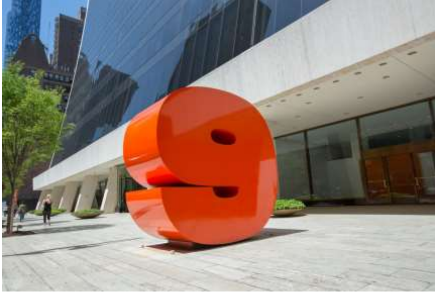
Resim 6: Kırmızı çelik “9” sayısı..

Yaptığı logoların yanı sıra Chermayeff'in bir diğer çalışması da Manhattan'daki 9 West 57th Street girişinde duran kırmızı çelikten “9” sayısıdır. 1974'te yerleştirilen ve tasarımcının üç boyutlu çalışmalarının en ünlülerinden olan “9” o günden beri yoldan geçenlerin ilgisini çekmiştir. Chermayeff'in bu çalışması aynı zamanda onun sanatçı kişiliğini ve disiplinler arası oynadığı aktif rolü simgelemektedir. Aynı zamanda bir illüstratör olan Chermayeff özellikle son yıllarında ilgisinin iyice arttığı kolaj tekniği ile ilgili birçok çalışma da üretmiştir.