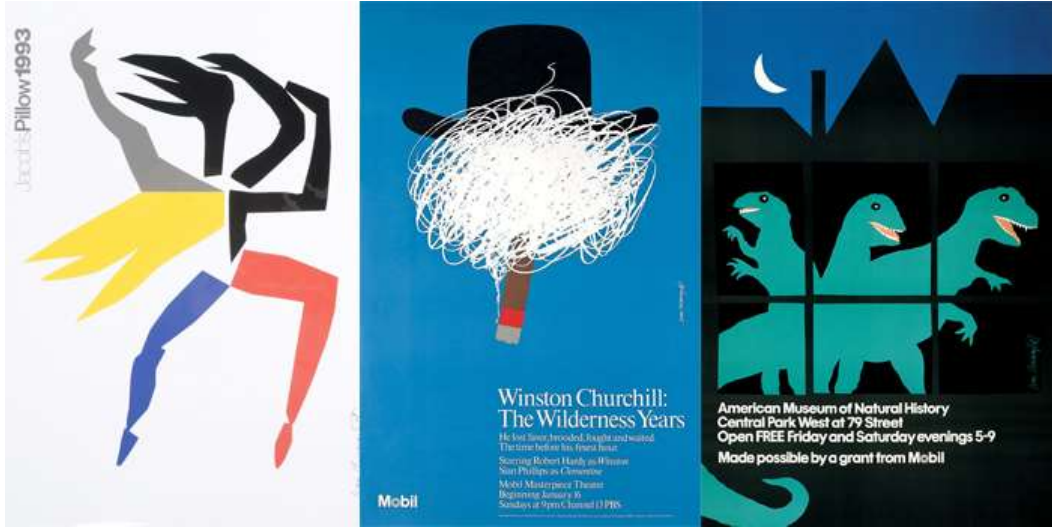
Resim 5: Chermayeff afişlerinden bir seçki

Koç Holding ve bazı Koç kuruluşlarının amblem, logo, kurum kimliği gibi çalışmalarını gerçekleştirerek ürettiği yetkin ve sıra dışı tasarımlarla bu kuruluşların dolayısıyla da Türkiye'nin adını dünya tasarım literatürüne geçmesini sağlamıştır.