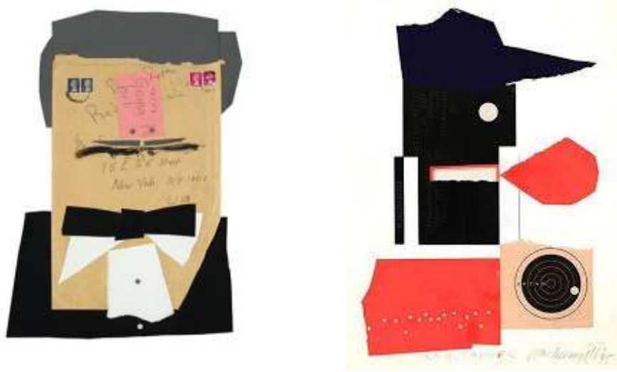
Resim 7: Chermayeff: Kolajları

Chermayeff, sadece bir grafik tasarımcı olmayıp aynı zamanda yaptığı birçok işle, hem soyut geometrik şekiller hem de figüratif görüntüler içeren tasarımlarıyla hayal gücü ile mükemmel bir rasyonel mantık dengesi kurmuştur. 1988-2002 yılları arasında New School Üniversitesi'ndeki Parsons Tasarım Okulu ve mütevelli heyetine yönetim kurulu üyeliği yapmıştır. Cooper Union, California Üniversitesi ve Kansas City Art Institute'da profesörlük yapmıştır. 1963'ten 1966'ya kadar AIGA Başkanlığı (Amerikan Grafik Sanatları Enstitüsü). 1965'ten 1986'ya kadar MoMA Mütevelli Heyeti (Modern Sanat Müzesi). 1968'den 1999'a kadar IDCA (Aspen Uluslararası Tasarım Konferansı) yönetim kurulu üyeliği 1972-76'da New York Belediye Sanat Derneği'nde Direktörlük gibi birçok yönetim kurulu üyeliği ve başkanlığı yapmıştır.