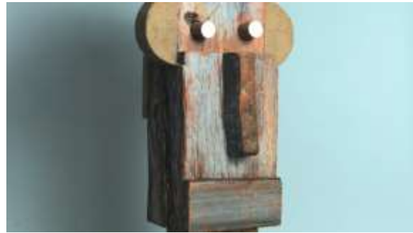
Resim 8: Küçük Heykeller

Chermayeff, sadece bir grafik tasarımcı olmayıp aynı zamanda yaptığı birçok işle, hem soyut geometrik şekiller hem de figüratif görüntüler içeren tasarımlarıyla hayal gücü ile mükemmel bir rasyonel mantık dengesi kurmuştur. 1988-2002 yılları arasında New School Üniversitesi'ndeki Parsons Tasarım Okulu ve mütevelli heyetine yönetim kurulu üyeliği yapmıştır. Cooper Union, California Üniversitesi ve Kansas City Art Institute'da profesörlük yapmıştır. 1963'ten 1966'ya kadar AIGA Başkanlığı (Amerikan Grafik Sanatları Enstitüsü). 1965'ten 1986'ya kadar MoMA Mütevelli Heyeti (Modern Sanat Müzesi). 1968'den 1999'a kadar IDCA (Aspen Uluslararası Tasarım Konferansı) yönetim kurulu üyeliği 1972-76'da New York Belediye Sanat Derneği'nde Direktörlük gibi birçok yönetim kurulu üyeliği ve başkanlığı yapmıştır.