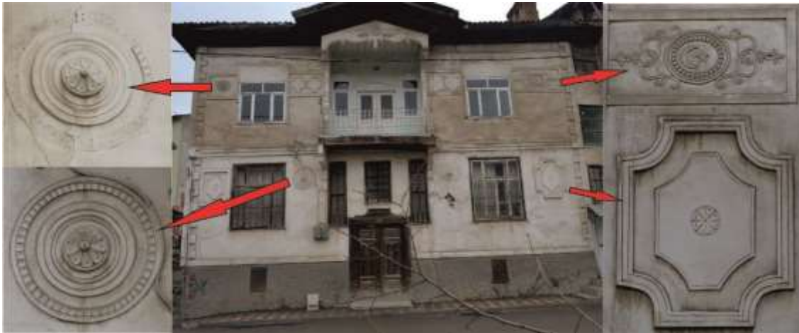
Resim 10. Cephe üzerine kalıpla kabartılarak yapılmış alçı süslemeler

Duvar yüzeyinde sadece Yeni Cami mahallesinde bulunan evde alçı süsleme uygulanmıştır. Evin giriş cephesi üzerinde toplam sekiz pano bulunur. İç içe geçmiş daire ve köşelerden iç bükey yuvarlatılmış dikdörtgen panolar içerisinde gülce ve dişlerden oluşan güneş motifi işlenmiştir. Sağ üste bulunan dikdörtgen panoda sağlı sollu simetrik yerleştirilmiş bitkisel motifler arasında çerçevelenmiş ay yıldız vardır. Cephenin kenarlarında, zeminden çatıya kadar olan köşebentler (dişler) eve zenginlik katmıştır (Resim 10).