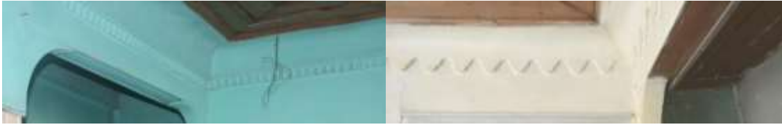
a) Dendan dış kuşaklar