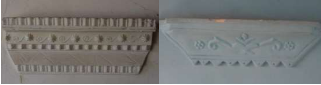
a) Mehmet Özel evi

İskilip evlerinde oda ve sofa içerisinde lambalık kullanımı yaygın değildir. Oda içerisinde, ocaklardaki şerbetlik rafları lambalık olarak kullanılır. Sofa, oda içerisinden pencereler ile aydınlatıldığı için, sofa içerisinde kullanımı enderdir. Bu lambalıklar batıdan ithal, merkez uygulamalarının taşrada taklitlerinden ibarettir. Toplam üç evde kullanılmıştır.