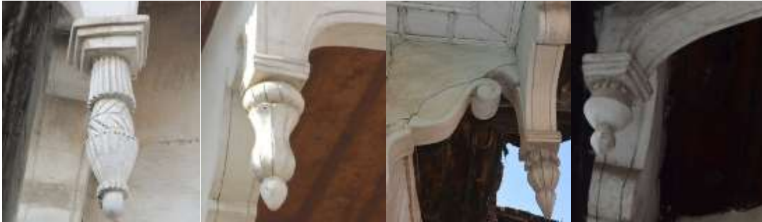
Resim 13. Alınlıklarda bulunan damlalık örnekleri