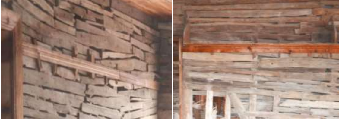
Resim 5. İç duvarlarda sıva payı adı verilen yatay yerleştirilmiş tahtalar. Aynı zamanda oda içerisinde askılık ve raf olarak kullanılır

parçaları ile sıvanın kalınlığı (5-10 cm) ayarlanır. Eski ustalar bu ağaçlara sıva payı derler. Sıvanın kalınlığına ve perdahlanmasını sağlar. Üzeri sıvanmaz. Oda içerisinde bu tahtaların üzerine raf (sergen) yerleştirilir. Bazı örneklerde çiviler çakılarak askılık olarak da kullanılmıştır (Resim 5).