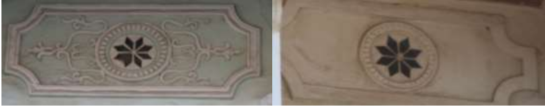
a) Hatice İkinci evi alçı pencere

(Resim ). Sadık Hotunlu evinde panonun içerisi, simetrik şekilde üsluplaştırılmış kıvrım dallar ve palmet motifinden oluşan bitkisel bezemeler kullanılmıştır (Resim 11b).