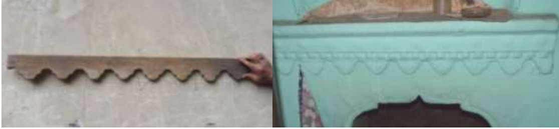
Resim 8. Ağaçtan alçı kalıbı Resim 9. Ağaç kalıpla uygulanmış alçı süsleme

Alçı süslemede daha önceden hazır bulunan ağaç kalıplar duvara çakılarak motif uygulanır (Resim 8, Resim 9). Alçı kuruyunca kalıplar sökülür. Şerbetlik, lambalık gibi kabartmanın fazla olduğu yerlerde önceden kalıplanmış alçılar duvara monte edilir. Bazı örneklerde alçı kurduktan sonra üzeri kazınarak motif işlenmiştir.