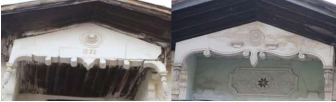
Resim 12. Alçı ile süslenmiş alınlık örnekleri

Alınlıklarda dört evde alçı süsleme uygulanmıştır. Alınlıklar ve destekleri “S” kıvrımlıdır. Kıvrımlar salyangoz motifi ile tamamlanmıştır. Ön yüzünde madalyon içerisinde dişler ve tarih yazıları bulunur (Resim 12). Konsolların uçlarında ise üzeri yivli, iki ya da üç boğumlu damlalık bulunur. Bunlar, daha önceden kalıplara dökülmüş, sonradan alınlığa yerleştirilmiştir (Resim 13).