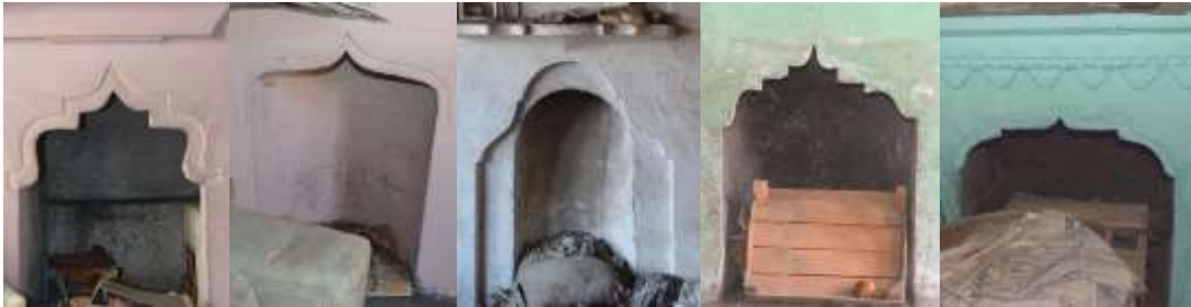
Resim 15. Geç dönemde barok kıvrımları yapılmış ocak ateşlik kemerleri

Çalışılan evlerde en çok kullanılan süsleme ocaklarda bulunan alçı işleridir. Toplam yetmiş dört evin elli altısında ocaklar süslenmiştir. Ocak, ateşlik ve şerbetlik olarak iki bölüme ayrılır. Erken tarihli örneklerde ateşlik kemerleri sadedir. Geç tarihli olanlarda S ve C barok kıvrımları ile estetik bir görünüm kazandırılmıştır (Resim 15). Kalıplama yöntemi ile sağlı sollu simetrik şekilde yapılmıştır.