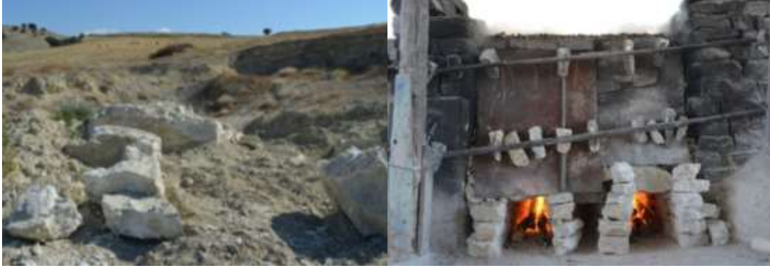
Resim 1. Kılıçdere köyü, alçı yatakları Resim 2. Kılıçdere köyü, alçı ocağı

Bugün, Kılıçdere köyünde halen geleneksel yöntemlerle üretime devam etmektedir. İşletme sahibi Osman Şentürk (2017) ailesiyle birlikte üç kuşaktır tatlı kireç (alçı) üretimi yapmaktadır. Üretilen alçı Çorum, Tokat ve Sivas'a pazarlanmaktadır.