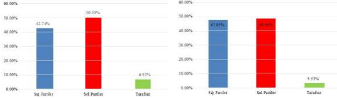
Şekil 3: 2009 Avrupa Parlamentosu Seçimleri Şekil 4: 2014 Avrupa Parlamentosu Seçimleri