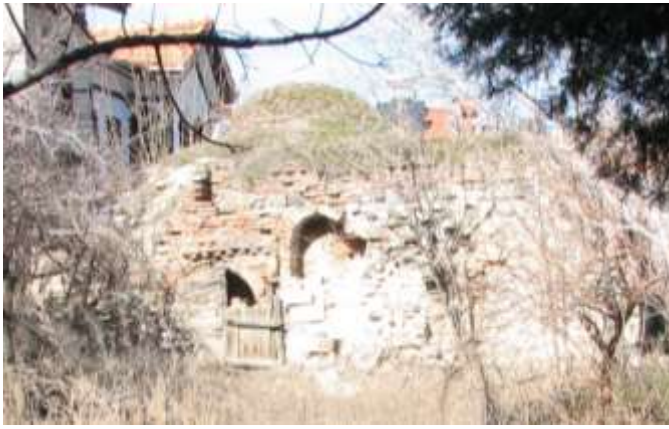
Fotoğraf 15. Azmizadeler Hamamı. Külhan ve Su Deposu (22.02.2019).