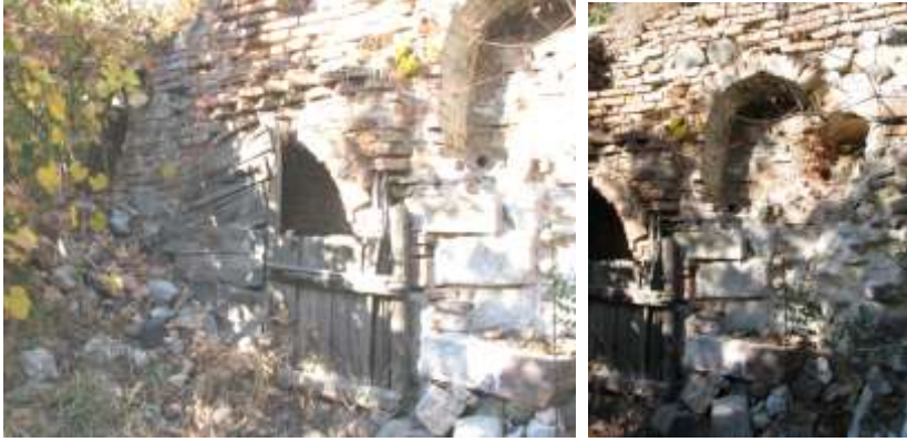
Fotoğraf 13-14. Azmizadeler Hamamı. Külhan ve Su Deposu (03.11.2018).