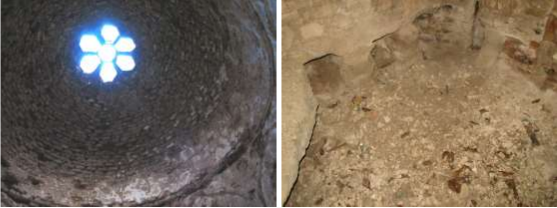
Fotoğraf 11-12. Azmizadeler Hamamı. Sıcaklık Mekanı (03.11.2018).

1970 depreminde hasara uğrayan yapı bugün işlevsizdir. Hamam, Gediz'in ileri gelen ailelerinden Azmizadeler'e aittir. Kitabesi yoktur. Kaynaklarda Osmanlı döneminden kaldığı belirtilmektedir (Eskigediz: 5).