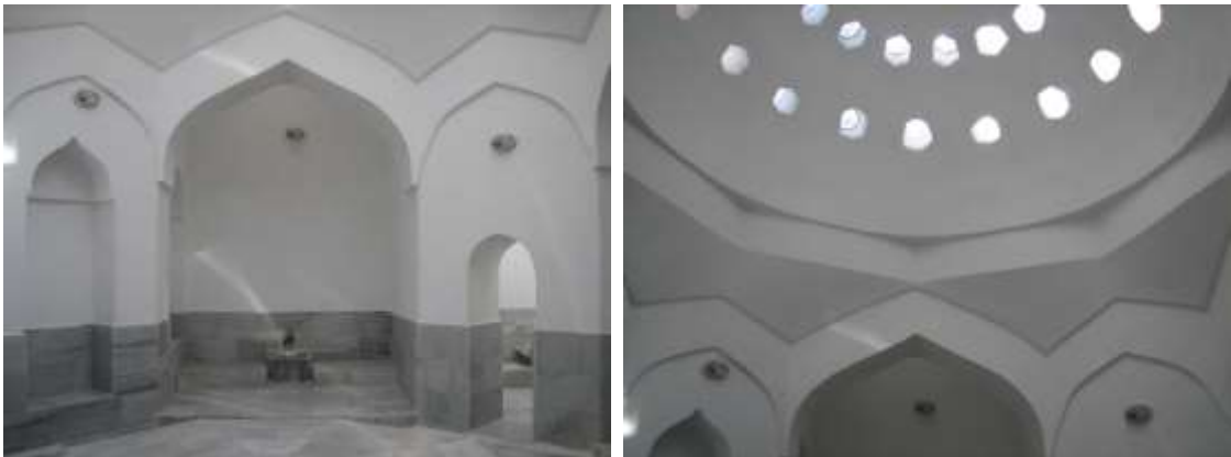
Fotoğraf 5-6. Gazanfer Ağa Hamamı. Kadınlar Kısmı Sıcaklık Mekanı.