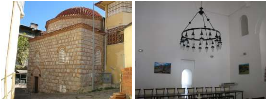
Fotoğraf 3-4. Gazanfer Ağa Hamamı. Kadınlar Kısmı Girişi. Kadınlar Kısmı Soyunmalık Mekanı.