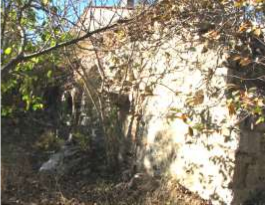
Fotoğraf 10. Azmizadeler Hamamı. Dış Cephe (03.11.2018).

Soyunmalık mekanının kuzey duvarındaki sivri kemerli açıklık ile yaklaşık 10 m 2 lik, kare planlı sıcaklık mekanına geçilmektedir. Mekan, geçişleri tromplarla sağlanmış bir kubbe ile örtülüdür. Kubbe tuğla ile inşa edilmiştir. Kubbedeki beşgen formlu filgözleri yedi adettir. Sıcaklık mekanının kuzey duvarında sivri kemerli bir niş bulunmaktadır. Mekanın zemin kaplamaları tahrip olmuş, cehennemlik ayakları, duvarlardaki künkler ortaya çıkmıştır. Yapının batı cephesinde su deposu ve külhanı yer almaktadır. Hamamın inşasında kesme, kabayonu ve moloz taş cinsleri ile tuğla kullanılmıştır.