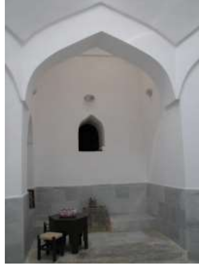
Fotoğraf 7-8. Gazanfer Ağa Hamamı. Erkekler Kısmı Sıcaklık Mekanı.

Azmizadeler Hamamı: Kavakaltı Camii'nin kuzeyindeki bahçededir. Dikdörtgen planlı hamam, soyunmalık mekanı, sıcaklık mekanı ve su deposu ile külhandan oluşmaktadır 9 . Hamamın soyunmalık mekanına mekanın kuzey duvarındaki bir giriş açıklığı ile ulaşılmaktadır. Açıklık sivri kemerlidir. Soyunmalık mekanı dikdörtgen planlıdır. Güney duvarında sivri kemerli bir niş vardır. Örtü yıkılmış, zemin molozlarla dolmuştur.