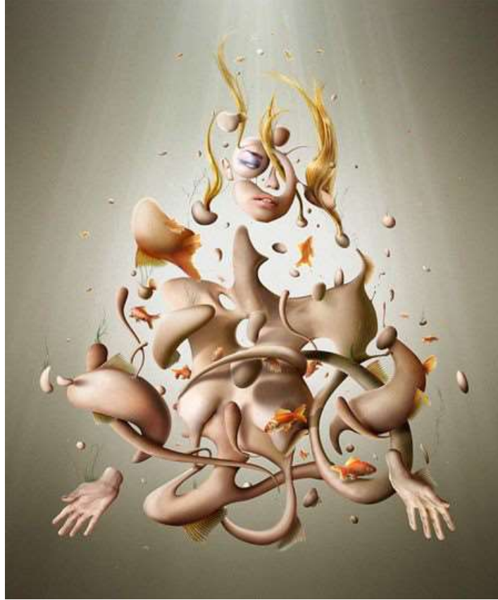
Resim 6: Mitolojik Dijital Çalışma Örneği.

Örnek olarak, Jerico Santander, çalışmasında mitolojik öğelerden faydalanmıştır. Yunan Mitolojisinde nereid, su perisi ya da nehir perisi anlamına gelmektedir. Bu anlamda, çalışmadaki su perisi, birbirine geçmiş parçalar halinde etrafındaki deniz canlıları (balıklar) ile birlikte betimlenmiştir. Nereid'in bedeni üzerinde yükselen ışık huzmesi dikkat çekicidir ve onun mitolojik değerini vurgulamak için tasvir edildiği söylenebilmektedir (Atan ve Diğerleri, b.t.).