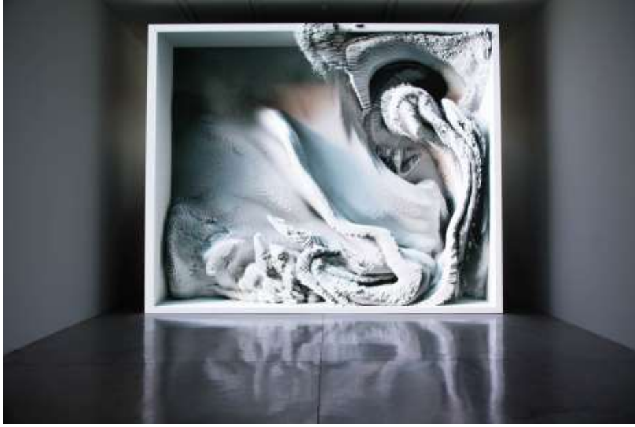
Resim 7: Refik Anadol, “Eriyen Hatıralar”

Çağdaş teknolojinin gelişiyile resim sanatı etkilenmiştir. Etkilendiği konular olarak; Resim sanatındaki güzeli arama çabası yerini farklı kaygılara bırakmıştır. Resim sanatında gördüğünü resmetme çabası vardır, dijital sanatta ise daha çok bir fikri, imgeseli resmetme ve resmettiği çalışmayla bir mesaj ya da bilgi verme çabası vardır. Genellikle konuyu direkt açıklamaz. Resim sanatındaki estetik kaygı teknolojinin gelişmesiyle etkilenmiş ve yerini bambaşka kaygılara bırakmıştır.