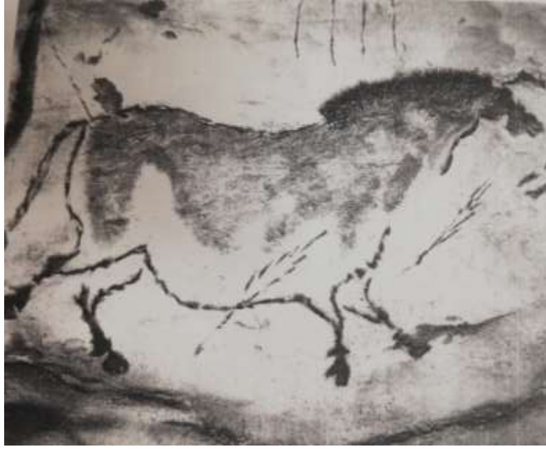
Resim 1: Mağara Resmi.