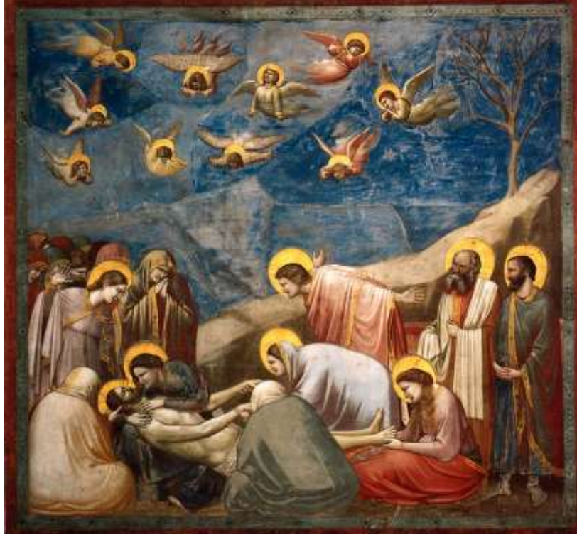
Resim 3: Giotto, “Ağıt” isimli Eseri.

Minyatür tekniğinde yapılan çalışmaların gelişmesiyle orta çağın sonuna doğru resim sanatına temel olacak değişimleri sağlayan Giotto bu anlamda önemli adımlar atarak resimleri tablolara uygulamaya başlamıştır. Kutsal konuları yenilikçi bir yaklaşımla sergileyen bir sanatçı olarak bilinir. Rönesans'ta, realist bir üslupla ve çoğu zaman azizleri ve dini figürleri konu edindiği eserler ortaya çıkarmış ve Giotto Rönesans'ın babası olarak adlandırılmıştır.