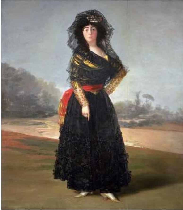
Resim 8: Alba Düşesi'nin Siyahlar İçindeki Portresi.

Alba, Çok kısa bir sürede tüm dikkatleri üzerine toplamış ve İspanya'nın diğer düşeslerinden sıyrılarak farklı bir imajla yol almıştır. Goya, yazdığı mektuplardan birinde Alba Düşesi'nin stüdyosuna uğrayarak, kendisine makyaj yapıp yapamayacağını sorduğundan söz etmektedir. Bunun karşılığında ressam da, Alba Düşesini kırmadan ricasını kabul etmiş ve ona makyaj yaparken tuval üzerine resim yapmanın bundan daha zevkli olduğunu söylemiştir. Bu sırada Alba Düşesi, sanatçıdan tam boy bir portre istediğini söylemiştir ve Goya'nın resmettiği Alba Düşesi Portreleri böylece doğmuştur.