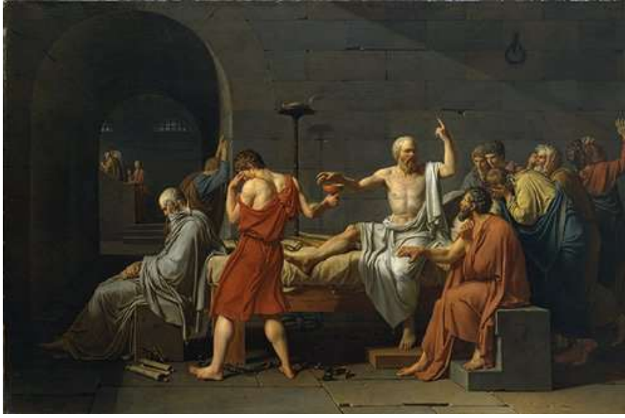
Resim 4: Jacques Louis David, Socrates'ın Ölümü.

Genellikle manzara ve toplum yaşantısını ele alan sanatçılar artık kendini yeni teknik ve kurullarla ortaya koymaya başlamış ve eserlerinde doğa ve insan sevgisini betimlemeye çalışmış ve günlük yaşantının dışına çıkarak sürrealist yaklaşımlarda da bulunmaya başlamışlardır. Mesaj ileten ve iletişim aracı olarak mağara resimlerinde kullanılan figür ve eserlerin yerini, 20. Yüzyılda daha özgür ve resim kurallarının dışına çıkarak gerçeküstü resimler yaratan sanatçıların eserleri almıştır. Salvador Dali bu akımın öncülerindendir.