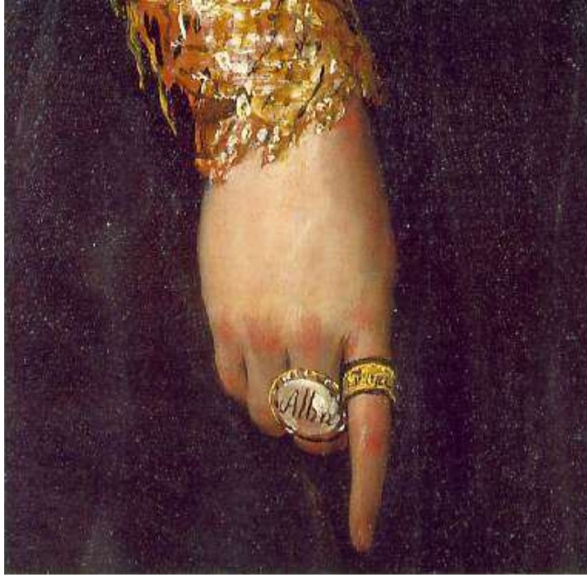
Resim 9: Alba Düşesi'nin Siyahlar İçindeki Portresi'nden Detay.

Goya, fonu oluşturan ağaçları flu etki yaratmış, gökyüzünü gri renge boyayarak ve Alba'yı ön planda tutarak geleneksel bir manzara kompozisyonu ile tamamlamıştır. Buradaki manzara ise Alba'nın özel mülkünden bir görüntüdür.