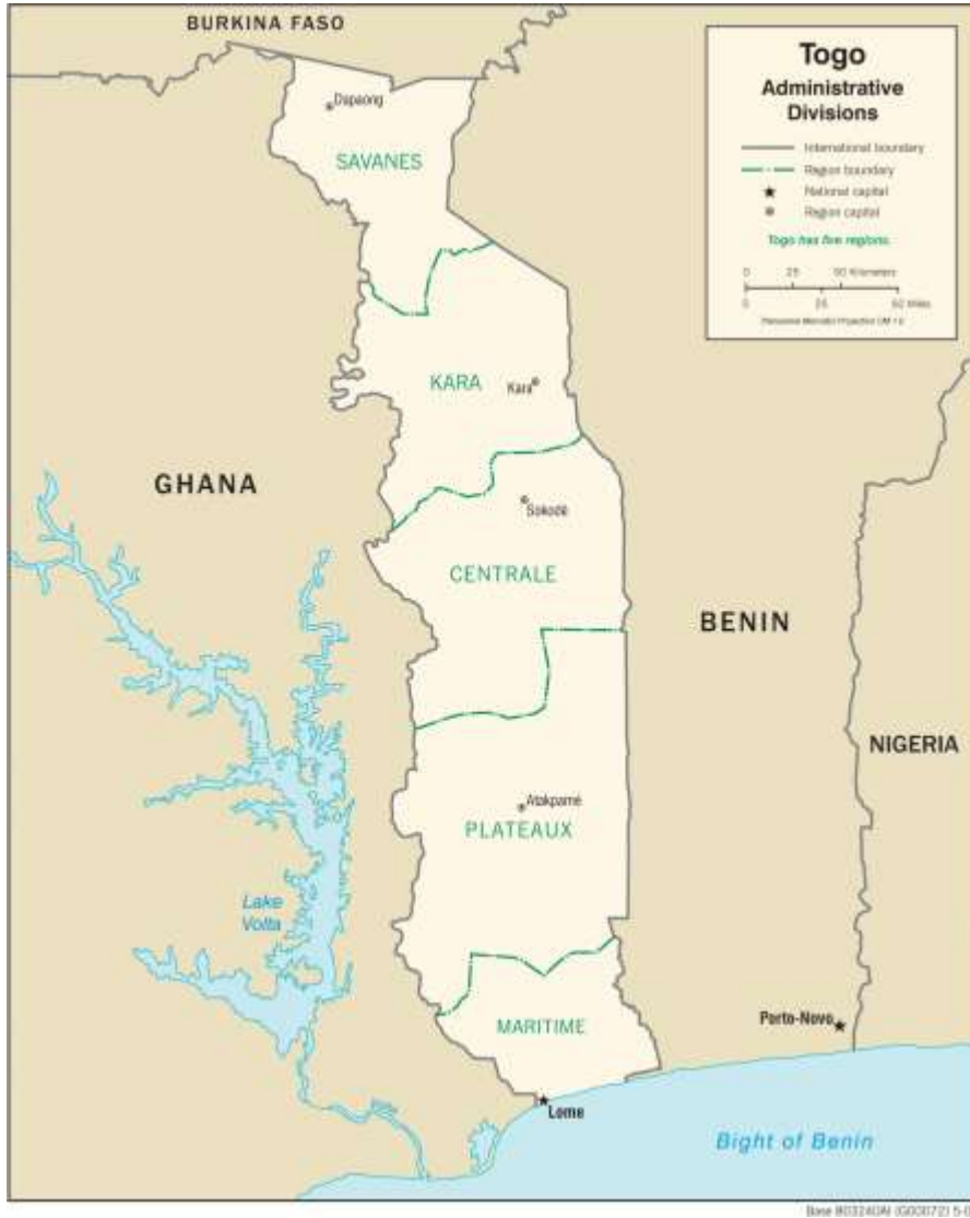
Harita 2: Togo siyaset haritası

Bu ticaretin yönü, kuzeydeki halklar için güneyde olanlara karşı acı anıları bırakabilmektedir. Count von Zech tarafından 19 Ocak 1897'de Logba halkından kuzeydeki Kabiye toplumu doğusunda toplanan ifadeler bunu iyi göstermektedir. Nitekim, Logba halkına Lama halkının aleyhine yaptığı koruma teklifinde, müdahillerinden şu cevabı alınmıştı: "Oradaki halklar (onun müdahili güney yönünü göstererek) bize gelip ve "Lama halka karşı size yardım etmek istiyoruz " deyince, o zaman kavgalarımızı durduruyoruz ve Lama'larla birlikte bizden yardım isteyenlerle savaş yapacağız; Kabrè halkı olarak biz biriz " (Napo 1976: 380).