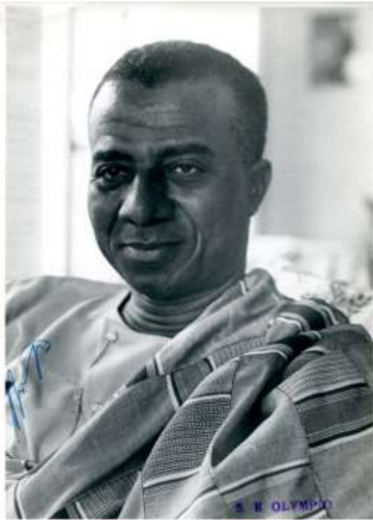
Sylvanus Olympio (1902-1963) : Togo'nun ilk Cumhurbaşkanı