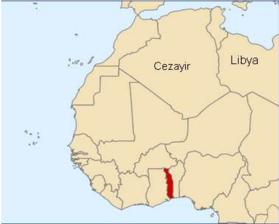
Harita 1: Batı Afrika'da yerleşen Togo

Ajatado bölgesini oluşturan güney Togo, kuzeyden farklı özellikler sunmaktadır. Bu bölgenin yerleşimi daha homojen görünmekteyse azınlıkların varlığını söyleyebilmekteyiz: Guin-Mina, Ife, Fon, Akposso, Akebou etnik grupları.