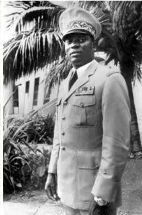
Eyadema Gnassingbe (1935-2005) : 1963'te darbe yapılmış olan ve askeri yönetimi getiren komutanı

13 Ocak 2017'de Togo, Gnassingbe Eyadema isimli olan ve 2005 yılında hayatını kaybeden Komutanı'nı iktidara gelmesini elli yıl kutlamaktaydı. Fakat, aslında 1967'den beri